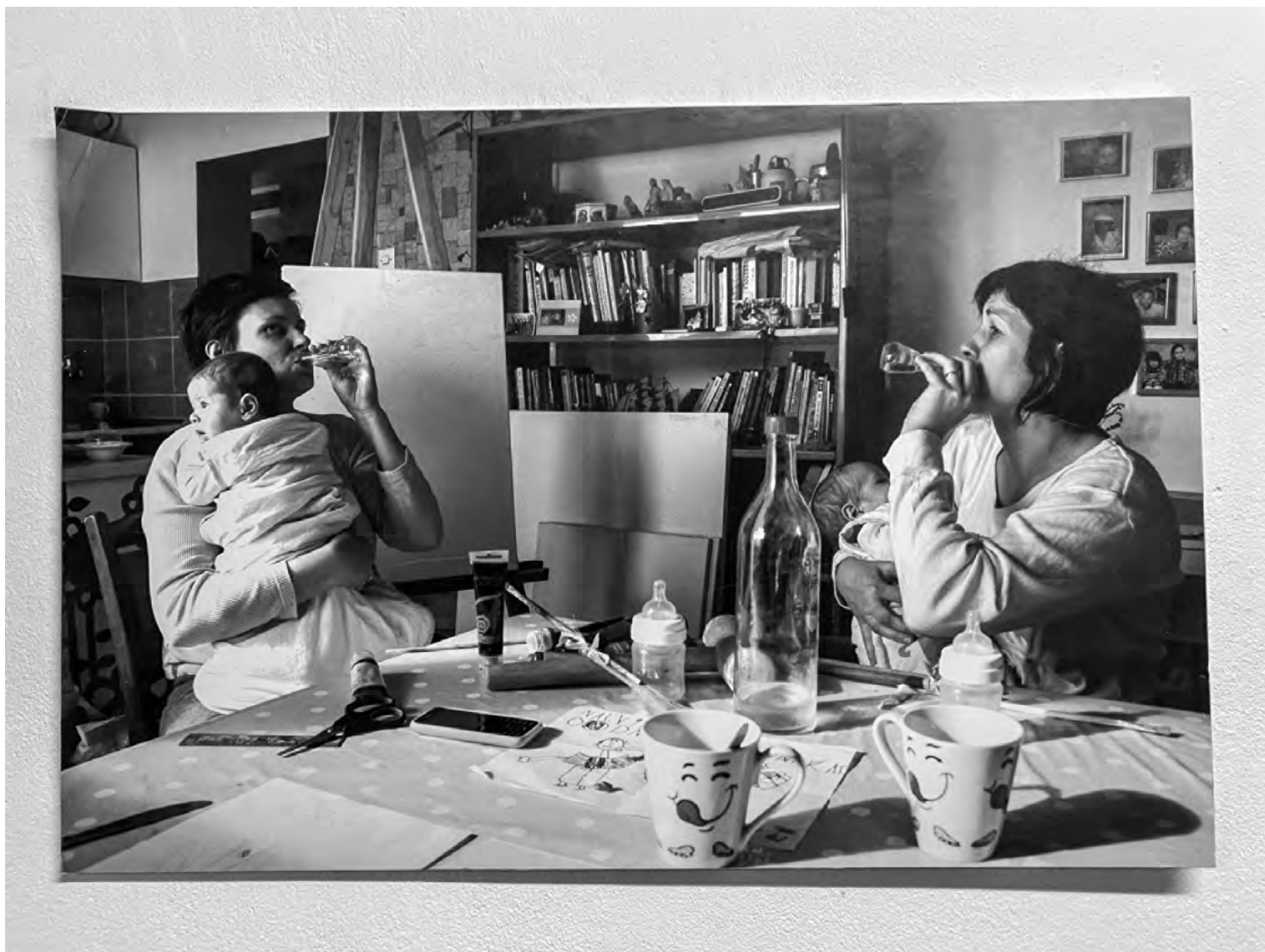
„Мајке”, Жужана Талос, фотографија на картону / са изложбе „Излазне стратегије”, октобар, 2022. год.

Након разврставања, МКРС је 14. септембра удружењима проследило Ексел табеле добијене од ПУ, са